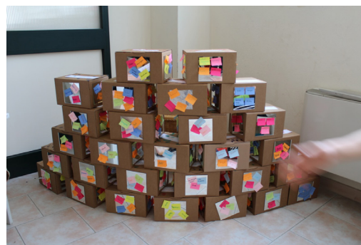
Persönliche Boxen